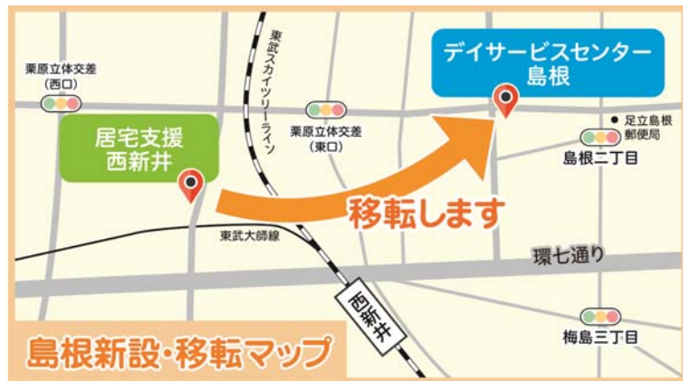
島根新設・移転マップ

足立区島根にデイサービスと居宅介護支援の複合型在宅介護施設をオープンいたします。